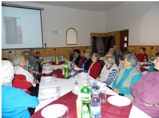
Beseda s důchodci 2015